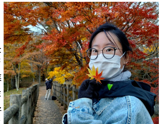
やまなかこ あさひがおか こはん りよくち こうえん そ はく 山中湖 旭日丘湖畔緑地公園にて 蘇博さん

シトウなど、たくさんの野菜を収穫しました。大好きなナスとシトウの生姜炒めの料理を作り、大満足でした。