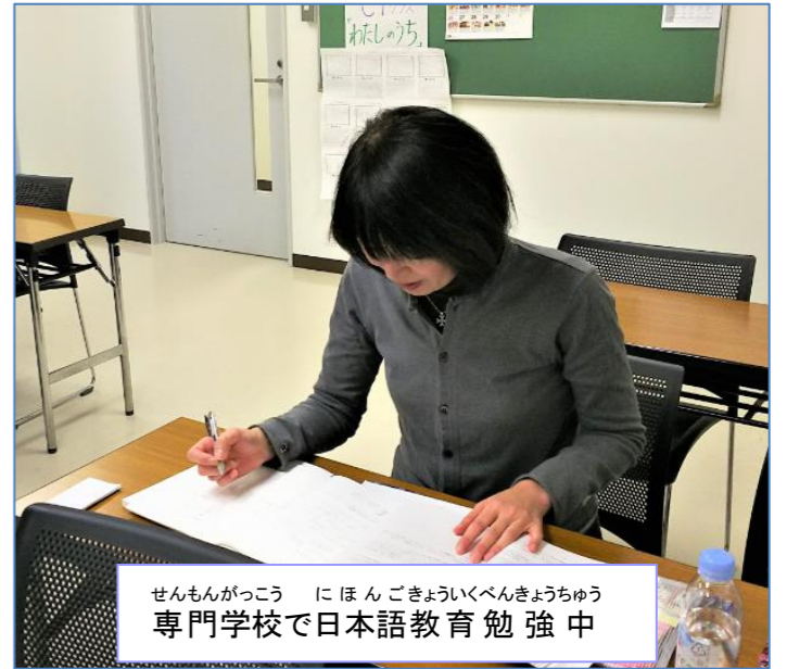
せんもんがっこう にほんごきょういふべんきょうちゅう 専門学校で日本語教育勉強中

私は仕事の都合で取手から東京へ引っ越したため、毎回出席するのが難しくなりました。しかし日本語を学ぶ皆さんの笑顔を見るのが楽しいので続けたいと感じています。これからもよろしくお願ひします。