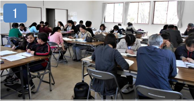
にほんごきょうしつ 日本語教室

TIFAでは、中央教室(福祉会館)が金曜日に「午前の部」「夜の部」の2教室、戸頭教室(戸頭公民館)が「火曜日・夜」「日曜日・午前」の2教室で、外国出身者の日本語学習支援をしています。