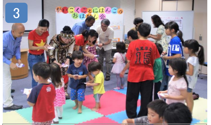
かい がいこくごと にほんごのおはなし会

日本文化体験・会員/市民交流をしたいとの学習者の要望に応えるため、交流部主催のイベントに参加してもらうことを、3年程前より進めてきました。