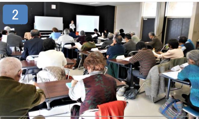
こうざ スキルアップ講座

一方、日本語学習を支援する日本語ボランティアは34名です。支援を継続して行くには、日本語教育の知識・技能の習得・向上が必要となります。