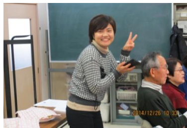
T C S