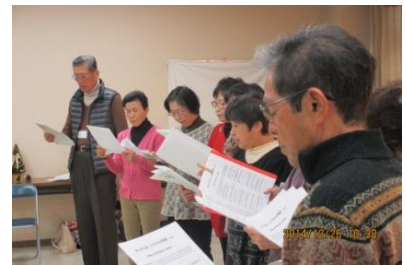
さくら荘英語教室